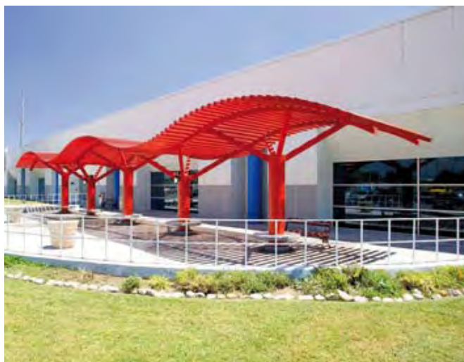
Smiths Healthcare Manufacturing, S.A. de C.V.

Smiths Healthcare Manufacturing, S.A. de C.V., formalizó el compromiso voluntario el 17 de agosto de 2001, con 88.9 por ciento en la evaluación del funcionamiento del Sistema de Administración en Seguridad y Salud en el Trabajo, SASST; 93.8 por ciento, en el cumplimiento de la normatividad en seguridad y salud en el trabajo, y una tasa de 1.89 accidentes por cada cien trabajadores.