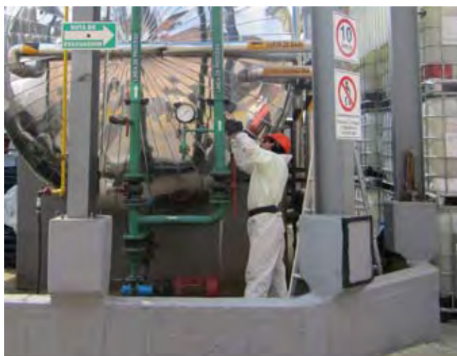
Ashland Chemical de México, S.A. de C.V.

Al aplicar las guías del Programa y elaborar el diagnóstico inicial del centro de trabajo, se observó la falta de involucramiento de los