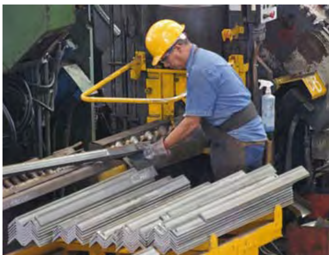
Sae Towers México, S. de R.L. de C.V.

La empresa se incorporó al Programa de Auto-gestión en Seguridad y Salud en el Trabajo, PASST, en el año 2001, con los resultados