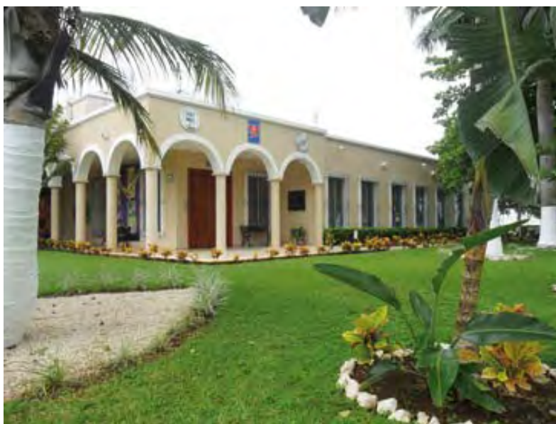
Barcel, S.A. de C.V. -Planta Mérida-

Barcel, S.A. de C.V. -Planta Mérida-, se encuentra ubicada en Calle 60 Diagonal No. 497, Col. Parque Industrial, Mérida, Yucatán, C.P. 97300, y cuenta con una plantilla de 150 trabajadores.