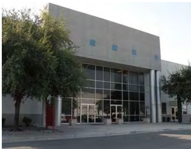
GE Electrical Distribution Equipment, S.A. de C.V.

GE Electrical Distribution Equipment, S.A. de C.V., se inscribió al Programa de Autogestión en Seguridad y Salud en el Trabajo, PASST, el 31 de marzo de 2000. Sin embargo, siempre ha considerado como fundamental, dentro de su política de seguridad, higiene y medio ambiente, la prevención de la contaminación, accidentes y enfermedades laborales; el cumplimiento a los requisitos legales, así como la mejora continua en todas las acciones de prevención en la materia.