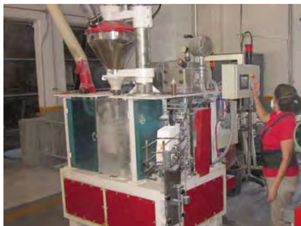
Harinera de Sinaloa, S.A. de C.V.

Harinera de Sinaloa, S.A. de C.V., se encuentra ubicada en Boulevard Emiliano Zapata No. 3198, Col. Industrial Palmito, Culiacán, Sinaloa, C.P. 80160.