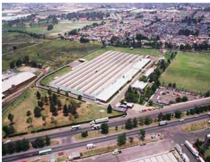
Pelikan México, S.A. de C.V.

La empresa se incorporó al Programa de Auto-gestión en Seguridad y Salud en el Trabajo, PASST, en julio de 2002, con 86.4 por ciento en la instauración del Sistema de Administración en Seguridad y Salud en el Trabajo, SASST; 90.2 por ciento, en el cumplimiento de la normatividad en seguridad y salud en el trabajo; cuatro accidentes de trabajo, y una tasa de 3.3 accidentes por cada cien trabajadores.