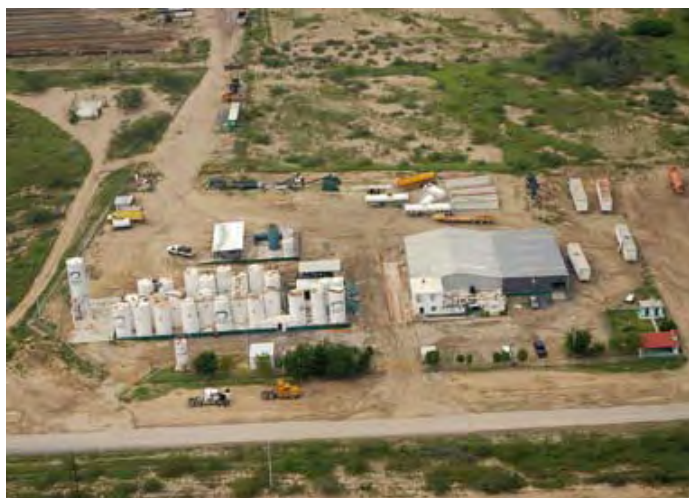
Qmax México, S.A. de C.V. -Planta Comales-

El centro de trabajo se ubica en Carretera Comales - Peña Blanca Km. 1, Col. Comales, Camargo, Tamaulipas, C.P. 88460, en donde laboran 25 trabajadores.