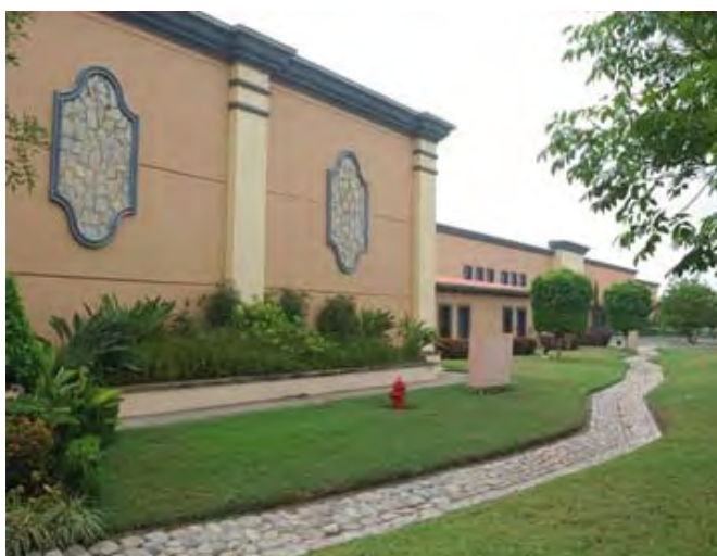
Kemet de México, S.A. de C.V.

El riesgo principal del proceso productivo es el atrapamiento o golpe en las extremidades superiores durante el ensamble de los equipos y accesorios, así como exposición a ruido y sustancias químicas.