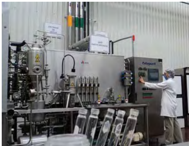
Palsgaard Services, S. de R.L. de C.V.

Palsgaard Services, S. de R.L. de C.V., siempre se ha preocupado por la seguridad, salud y bienestar de sus trabajadores, por lo que desde el año 2000 inició el establecimiento de los sistemas de gestión de la calidad y de la seguridad y salud en el trabajo.