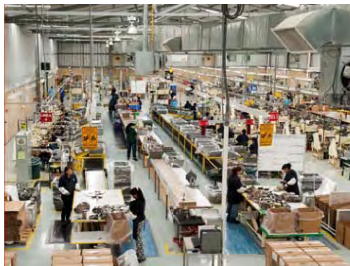
BHA Group Servicios, S.A. de C.V.

Antes de incorporarse al Programa de Autogestión en Seguridad y Salud en el Trabajo, PASST, la empresa contaba con prácticas relativas a la seguridad, salud y protección ambiental.