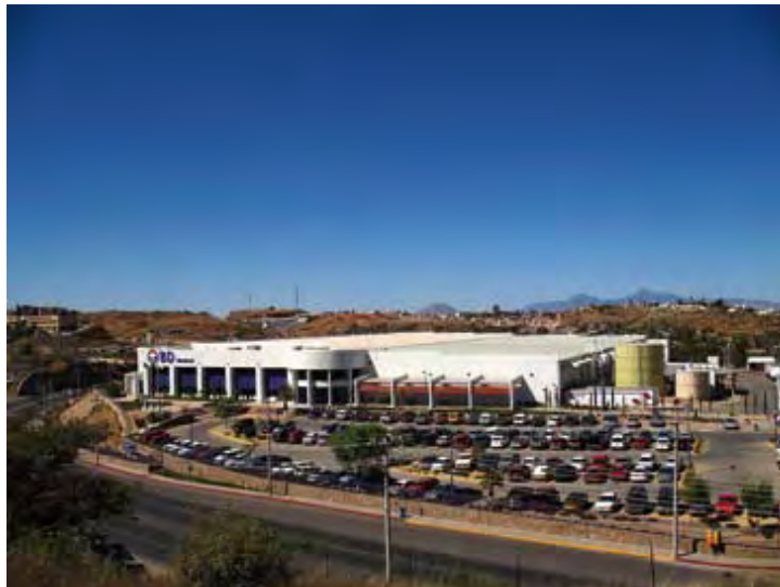
Becton Dickinson Infusion Therapy System Inc, S.A. de C.V.

Antes de incorporarse al Programa de Auto-gestión en Seguridad y Salud en el Trabajo, PASST, la empresa contaba con prácticas relativas a la seguridad, salud y protección ambiental.