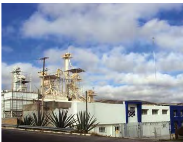
Nutec, S.A. de C.V.

El diagnóstico inicial permitió identificar áreas de oportunidad como la actualización de estudios para la evaluación de la concentración de sustancias químicas contaminantes del me-