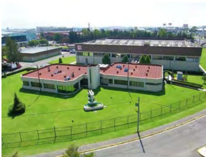
Siegwerk México, S.A. de C.V.

Siegwerk México, S.A. de C.V., siempre ha considerado los aspectos de seguridad, salud y protección ambiental con alta prioridad, destinando recursos humanos y materiales para mantener altos estándares en el cumplimiento de los requisitos legales de seguridad y salud en el trabajo.