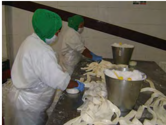
Derivados de Leche La Esmeralda, S.A. de C.V.

Sus principales clientes son: Wal-Mart de México, S. de R.L. de C.V.; Tiendas Comercial Mexicana, S.A. de C.V.; Costco de México, S.A. de C.V.; Tiendas Chedraui, S.A. de C.V.; Organización Soriana, S.A.B. de C.V.; Premium Restaurants Brands, S. de R.L. de C.V., y Operadora Domino's Pizza de México, S.A. de C.V.