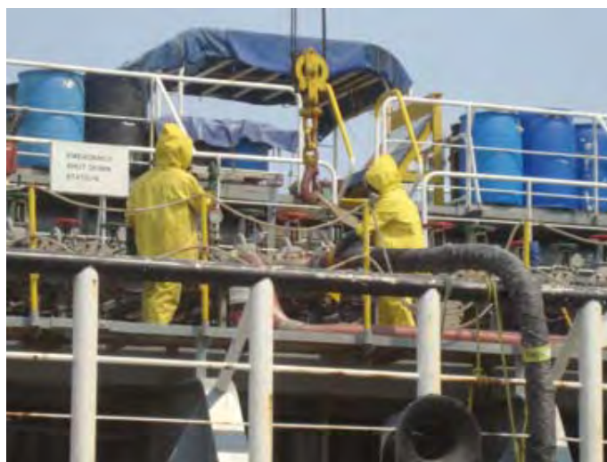
Grupo Celanese, S. de R.L. de C.V. -Terminal Marítima-

Antes de incorporarse al Programa de Auto-gestión en Seguridad y Salud en el Trabajo, PASST, la empresa sólo contaba con prácticas