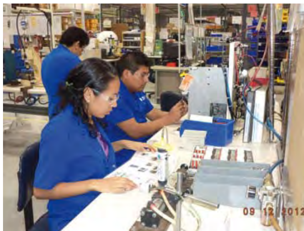
Eaton Controls, S. de R.L. de C. V.

Con el Programa de Autogestión en Seguridad y Salud en el Trabajo, PASST, se ha mejorado el involucramiento del comité de dirección, mandos medios y personal operativo; han sido implementados indicadores específicos para evaluar el cumplimiento normativo y los