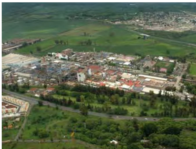
Grupo Celanese, S. de R.L. de C.V. -Complejo Ocotlán-

En marzo de 2000, la empresa formalizó el compromiso voluntario para su incorporación al Programa de Autogestión en Seguridad y Salud en el Trabajo, PASST, con una calificación inicial de 95.2 por ciento en la instauración del Sistema de Administración en Seguridad y