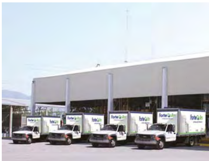
ForteQuim, S.A. de C.V.

Derivado del diagnóstico inicial, el centro de trabajo detectó áreas de oportunidad en lo referente a la protección y dispositivos de seguridad en la maquinaria; los procedimientos y normas de trabajo; el manejo, transporte y almacenamiento de materiales, así como la necesidad de reforzar la comunicación de riesgos por el manejo de sustancias químicas y algunas condiciones físicas de las instalaciones.