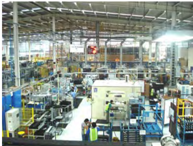
Automotive México Body Systems, S. de R.L. de C.V.

En la primera evaluación realizada al centro de trabajo, se obtuvieron calificaciones de 92 por ciento en la instauración del Sistema de Administración en Seguridad y Salud en el Trabajo, SASST, y de 98 por ciento, en el cumplimiento de la normatividad en la materia.