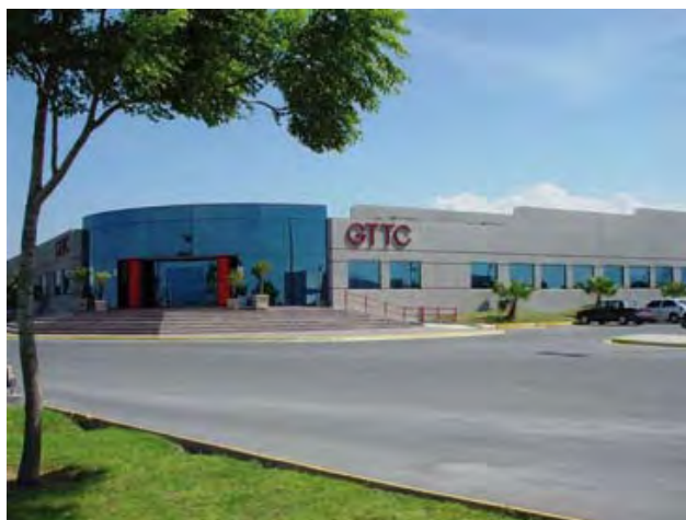
GE Toshiba Turbine Components de México, S. de R.L. de C.V.

El autodiagnóstico ha sido de gran utilidad como guía para evaluar el grado de cumplimiento de las normas oficiales mexicanas de seguridad y salud en el trabajo que deben observarse en el centro laboral.